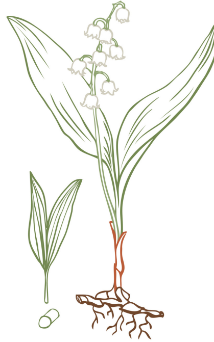
Maiglöckchen - giftig ☠️