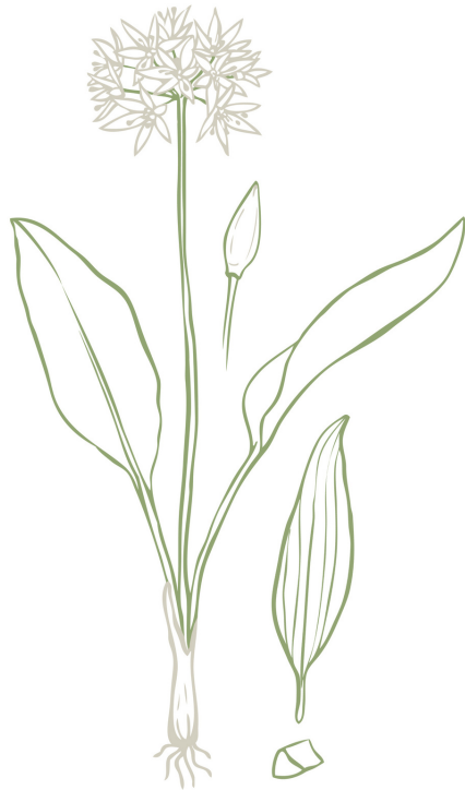
Bärlauch - essbar