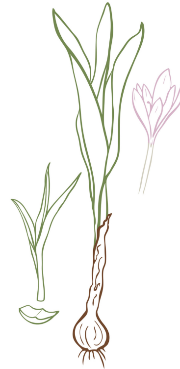
Herbstzeitlose - hochgiftig ☠️

TEILNAHMEBEDINGUNGEN: Die Teilnahme erfolgt auf eigene Gefahr. Details: siehe Allgemeine Geschäftsbedingungen.